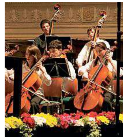
RIBALTA La «Cork Youth Orchestra» sarà a San Francesco al Prato