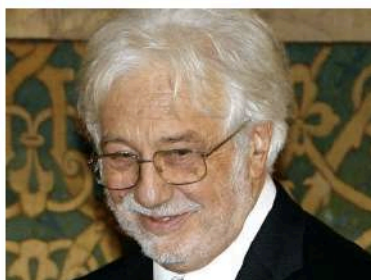
in foto: Luca Ronconi

Inizia domani 7 luglio e proseguirà fino al 9, per complessive 27 ore la maratona di proiezioni e incontri dedicati al maestro del teatro italiano Luca Ronconi scomparso nell'inverno 2015 al Festival dei Due mondi di Spoleto.