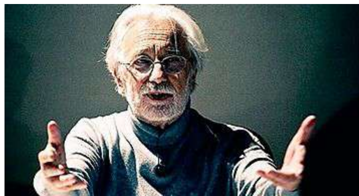
COMPIANTO Il regista Luca Ronconi collaborò con il Festival fin dal 1969

OGGI e domani si va avanti con la tante e preziose mostre disseminate in città, con il progetto dell'Accademia 2016 dell'European Young Theatre e con la musica (stasera alle 19.30 al Teatro Romano c'è la Banda del 1° Reggimento Granatieri di Sardegna), già da mercoledì riprendono i debutti con l'attesissima «Odissea a/r» di Emma Dante che rilegge liberamente il poema di Omero con gli allievi attori della «Scuola dei mestieri dello spettacolo» del Teatro Biondo di Palermo. Sarà in scena a San Simone fino a domenica e proprio